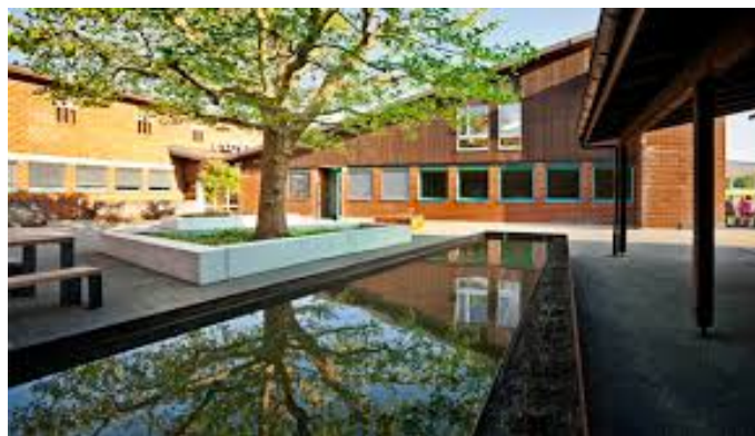
Klinik im Hasel, 5728 Gontenschwil, www.klinikimhasel.ch

Die Bücher können beim Workshop erworben werden.